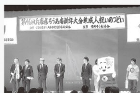
▲1月13日(月・祝) 第46 回兵庫県ろうあ者新年大会 兼成人祝いのつどいに参加。