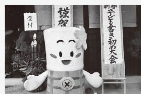
▲1月5日(日) 来住邸の新春 子ども書き初め大会で来場 の子どもたちを出迎えました。