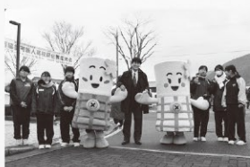
▲2月16日(日) 第12回西脇 多可新人高校駅伝競走大会 でランナーを応援!