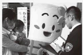
▲3月4日(金) 春の火災予防運動に参加。バザールタウンで住宅防火を呼びかけました。