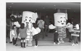
▲3月6日(日) Miraieで開かれた「緑化祭&環境・健康ふれあいまつり」を盛り上げました~

首まわり、肩丈(首後ろ)手首の長さ、胸周り、胸周りをスタッフが採寸します。この際、「少しゆつたりめに」「フィットする感じで」など好みの仕上がりをお伝えください。