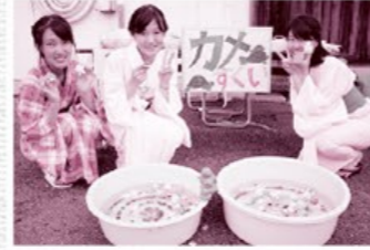
七夕ゆかた祭り、今年は7月7日開催。

平素より西脇TMOの活動にご理解とご協力を賜りまして、誠にありがとうございました。その活動をお伝えする本紙トモニュースは平成18年1月に第1号が発行されてから、おかげ様で41号を数えます。「西脇TMOって何？」といいますが、西脇の中心市街地活性化の為に、みんなの元気が集まる場所です。「どこでしてん？」といいますが、コア西脇の中心にある国登録有形文化財・旧来住家住宅を拠点として、日替わりシエレストラン梅吉亭、播州織の多彩な生地の中からオーダーシャツが作れる西脇情報未来館21、地元企業と学校の産学連携により播州織の新商品開発を行う播州織工房館など、全国から西脇に来られた方に、ええとこーええもんーをPRしてきます。さらに年間を通して、ひな祭り、こどもの日コンサート、七夕ゆかた祭り、おもちゃ大会、新年書き初め大会、個人・グループの展示会など、楽しい催しを展開しています。 中でも、私が一番大好きなイベントは七夕ゆかた祭りです。旧来住家住宅と播州織工房館を結ぶ道沿いに笹の葉が飾られ、シャツターで閉まつていたお店も、この日は出店して下さる人の汗で輝きを取り戻します。沿道はゆかた姿の人達であふれ、初夏の西脇に風情を感じさせます。メインの播州織ファッションショーもギャラリーでいっぱいになります。 「なんで七夕ゆかた祭りがなつかしく感じるんやろ？」ふと疑問に思ったことがあります。それは私がまだ幼かった頃、年に2日あった織物祭り。西は国鉄鍛冶屋線の西脇駅ロータリーから、上野交差点までの東西線が屋台の出店であふれていた。父の自転車の後ろに乗り、連れていかれた。父の自転車の後ろに、わくわくしました。父の自転車の後ろに、わくわくしました。父の自転車の後ろに、わくわくしました。