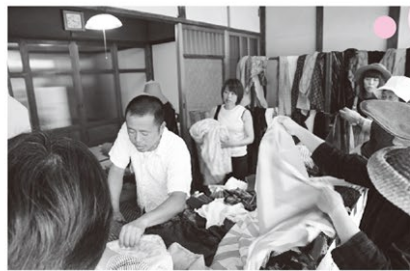
播州織の作り手から直接生地を購入できるところが魅力です。

昨年5月、 京阪神や岡山、富山、東京などから生地好き、手作り好き約5000人が訪れた「播博」。こと播州織産地博覧会が今年も開催されます。会場は同じく旧来住家住宅周辺エリア。かつての洋装店や文具店など商店街の空き店舗が、色とりどりの播州織生地が並ぶマルシェとして、一日限定オープンします。