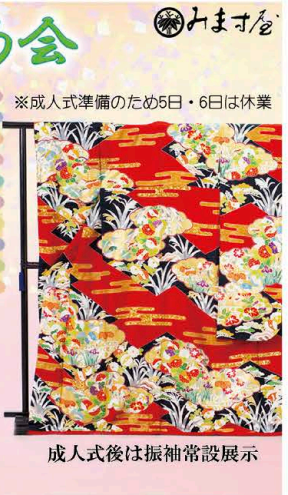
成人式後は振袖常設展示